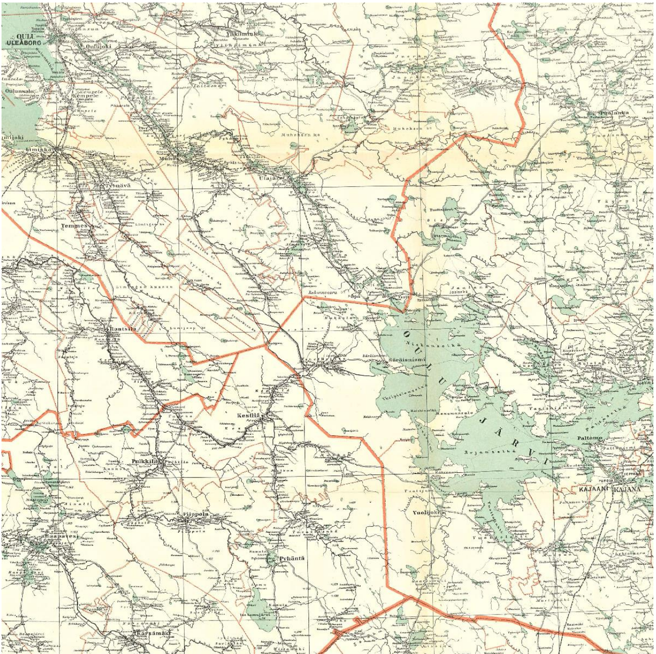
Kuva 1: Säräisniemen kunnan sijainti vuoden 1929 Oulun läänin kartassa.