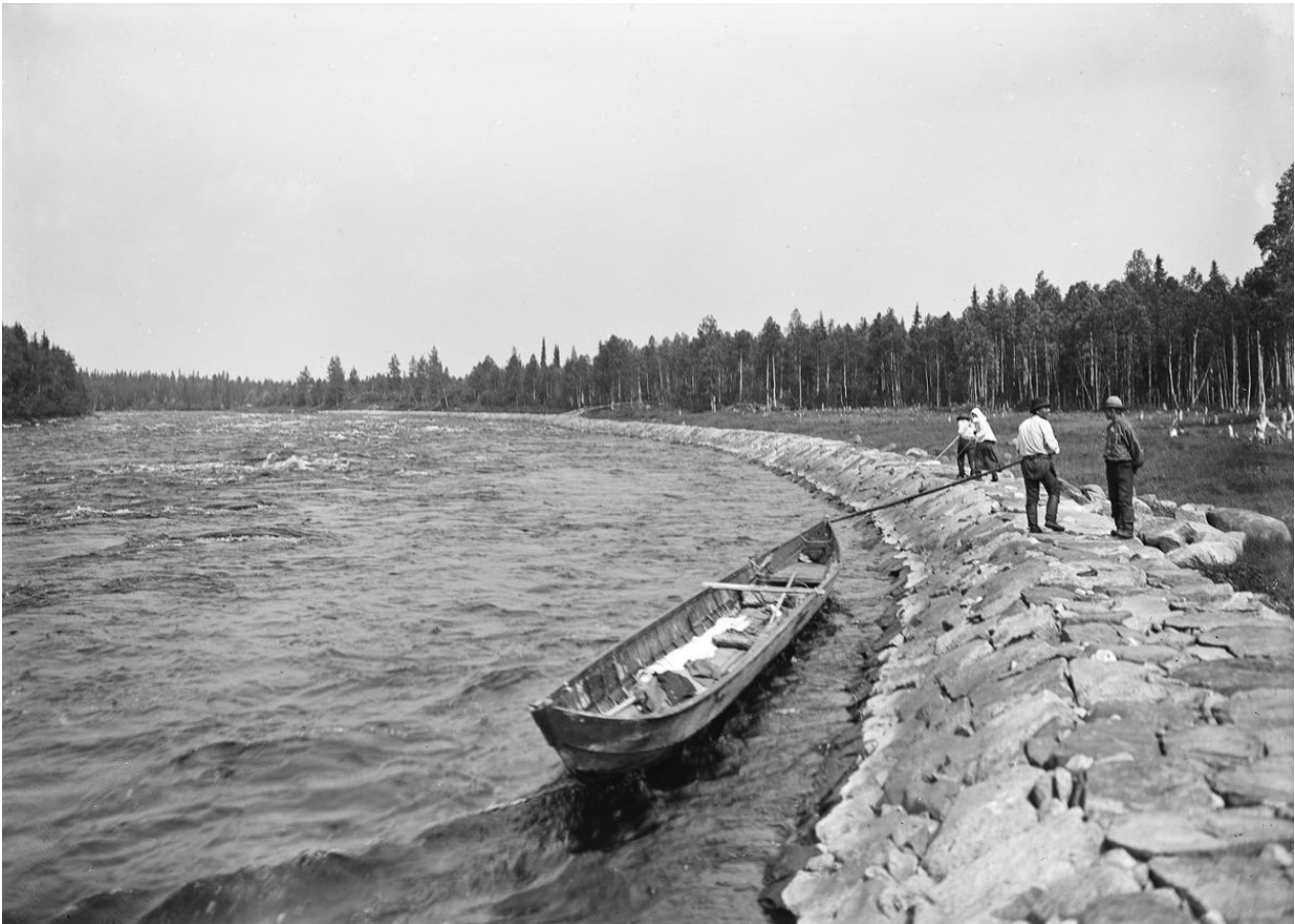
Kuva 3: Tervaveneen vetäjiä Vaalan Niskakoskella vuonna 1898. Kainuussa poltetulla ja Oulujokea pitkin Ouluun kaupaksi soudetulla tervalla on tärkeä osa kummankin alueen historiassa.