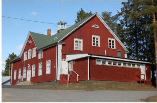
Kuva 2. Vesaisen linna.