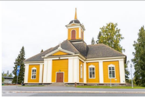
Kuva 3. Ylikiimingin kirkko.