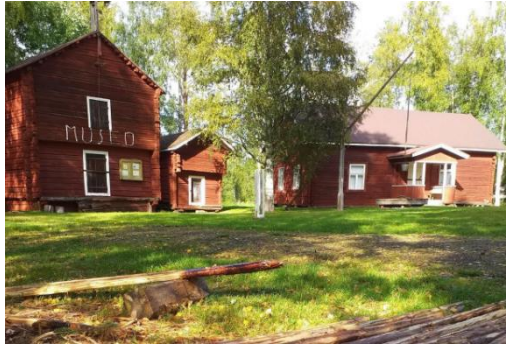
Kuva 3. Ylikiimingin kotiseutumuseo.