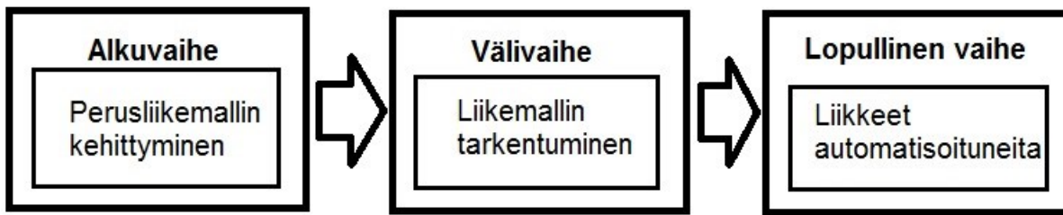
KUVIO 1. Taitojen oppimisen jatkumo (Coker, 2009, 114.)

Aivot ovat ihmisen motorista toimintaa säätelevän keskushermoston erityinen oppimiseen erikoistunut yksikkö. Tiedon käsittelyyn ja oppimiseen osallistuvat aina sekä tietoiset että tiedostamattomat keskukset. Nämä keskukset sijaitsevat eri puolilla aivoja. Niiden yhteistoimintaa ja vuorovaikusta varten tarvitaan aktiivinen ja joustava tiedonsiirto- ja käsittelyjärjestelmä. Tätä järjestelmää varten aivoissa on kymmeniä miljardeja hermosoluja, joiden välille voi muodostua moninkertainen määrä informaation kulun mahdollistavia yhteyksiä. Tietoaines eli informaatio kulkee sähkökemiallisesti hermosolusta toiseen pitkien viejähaarakkeiden eli aksonien avulla. Vastaanottava solun tuojahaarake eli dendriitti ottaa tiedon vastaan. Liitoskohdassa, jota sanotaan synapsiksi, tieto siirtyy solusta toiseen kemiallisen välittäjäaineen avulla. (Eloranta 2007, 217–218.)