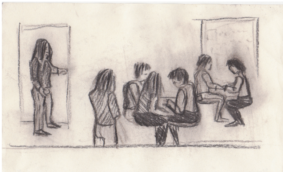
Kuva 1. Siirtolaisuusprojektin työskentelyä. (Kuva: Leena Järvenpää.)

Projektityöskentelyä ja yhdessä kirjoittamista havainnollistaa alla oleva piirros (ks. Kuva 1). Joustavat ja yhteisölliset työtavat kuuluivat projektityöskentelyyn. Oppilaat saattoivat soittaa isovanhemmilleen oppituntien aikana saadakseen tietoja kirjoittamisensa pohjaksi. Lukitsematon ovi historian luokkaan helpotti yhteistoimintaa, niin että oppilailla oli mahdollisuus käydä kysymässä opettajalta neuvoja tai tarvitsemiaan tietoja. Joustava järjestely edisti opettajien keskinäistä yhteistyötä ja jaetun asiantuntijuuden hyödyntämistä. Oppimisympäristö laajeni koulurakennuksessa sijaitsevaan yleiseen kirjastoon, missä oli mahdollisuus käydä etsimässä tietoa ja lainaamassa lähde-tekstejä.