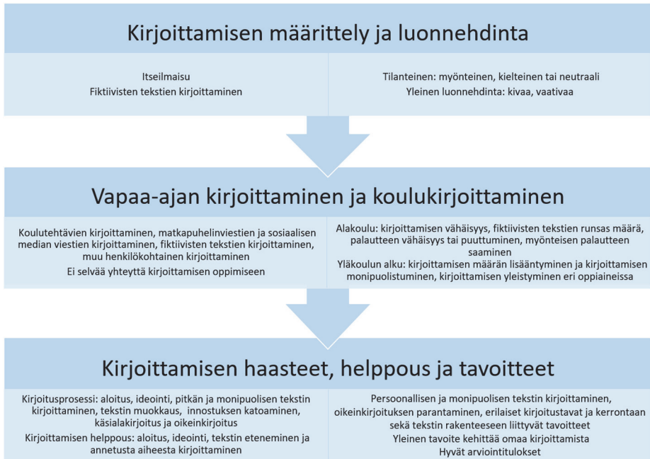
Kuvio 3. Ryhmähaastatteluaineiston keskeiset tulokset.