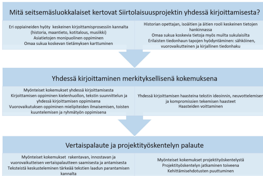
Kuvio 4. Yksilöhaastattelu- ja oppimispäiväkirja-aineiston keskeiset tulokset.