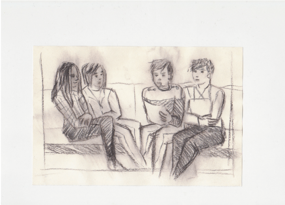
Kuva 2. Eräs ryhmähaastattelu.