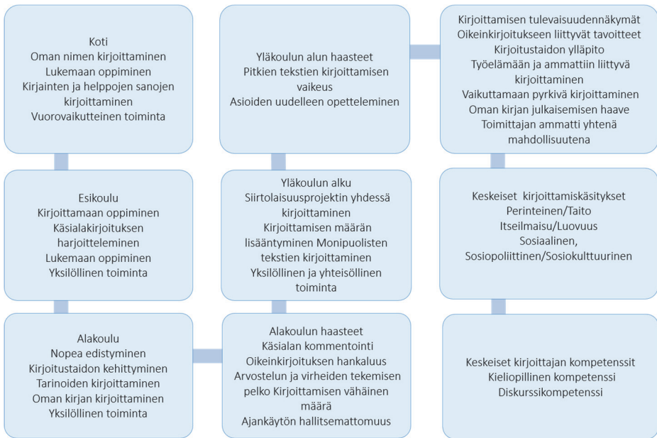
Kuvio 2. Kirjoittajan polkuni -aineiston keskeiset tulokset.

Maailmojen luomisessa keskeisiä olivat kirjoittamisen oppimisen paikat ja kirjoittamista tukeneet henkilöt, jolloin kerronnassa ei ollut viittauksia epäjärjestykseen. Kerronnan perusteella näyttäisi siltä, että tytöt olisivat saaneet opettajiltaan runsaammin myönteistä palautetta kuin pojat, joiden kerronnassa ei ollut viittauksia opettajan antamaan myönteiseen palautteeseen tai tukeen. Kuvio 2 sisältää kirjoittamisen vaiheita kuvailevan Kirjoittajan polkuni -aineiston keskeiset tulokset.