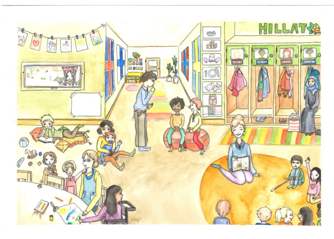
KUVA 1 Keskustelun virittäjäksi tuotettu piirroskuva (Ojala, 2018)

Tutkimusaineiston muodostaa virikehaastattelu, jonka kävivät pohjoissuomalaisen päiväkodin esiopetusryhmän kasvattajat piirroskuvan äärellä keväällä 2018. Virikehaastatteluun osallistuivat ryhmän kaksi lastentarhanopettajaa sekä lastenhoitaja, jotka olivat työskennelleet yhdessä samassa esiopetusryhmässä usean vuoden ajan. Esiopetusryhmässä työskenteli lisäksi ryhmäavustaja, joka ei osallistunut haastatteluun. Virikehaastattelun lähtökohtana toimi Politics of Belonging: Promoting children's inclusion in educational settings across borders -hankkeessa tuotettu piirroskuva (Kuva 1), jonka tarkoituksena oli toimia haastattelussa keskustelunherättäjänä.