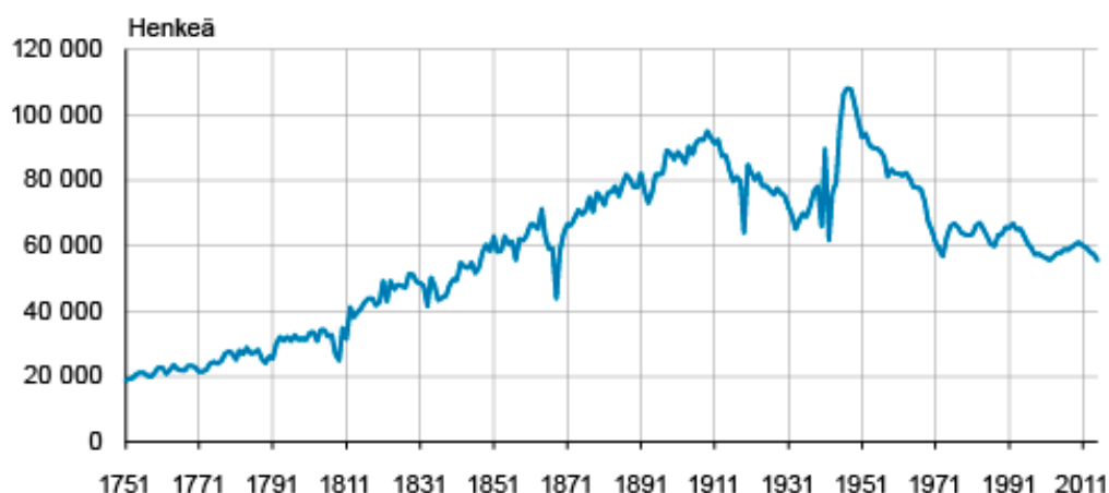
Kuvio 2. Syntyneiden määrä Suomessa 1751–2015. Tilastokeskus.