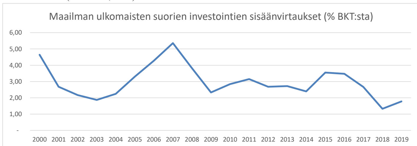
Kuva 1. Maailman ulkomaisten suorien investointien sisäänvirtaukset (% BKT:sta) (mukaillen Maailmanpankki 2021a).

Ulkomaiset suorat investoinnit nousivat maltillisesti vuonna 2019, tätä edelsi huomattavat laskut vuosina 2017 ja 2018. Suurin ulkomaisten suorien investointien vastaanottaja oli Yhdysvallat, jonka jälkeen tuli Kiina ja Singapore. Puolestaan suurimmat ulkomaiset suorat investoijat olivat Japani, Yhdysvallat ja Alankomaat. Kehittyviin maihin ulkomaisia suorita investointeja virtasi 685 miljardia dollaria, tämä on lähes kaksinkertainen summa verraten ulkomaisten suorien investointien ulosvirtaukseen, joka oli 373 miljardia dollaria. Kehittyneet taloudet puolestaan tuottivat hieman enemmän ulkomaisia suorita investointeja kuin mitä ne saivat. (UNCTAD, 2020)