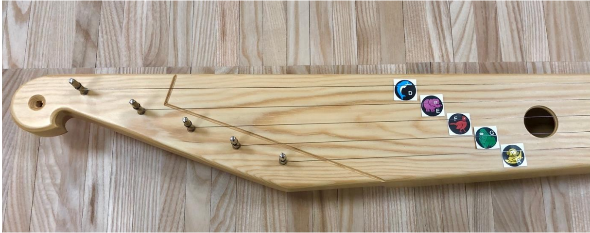
Kuva 2. Eläinkuvanuotit kanteleessa.

Eläinkuvanuotit sijoitin kanteleen kielten alle viistosti, jotta eläinkuvat erottuisivat toisistaan mahdollisimman selkeästi. Kuvassa 2 näkyvä kantele eläinkuvanuotteineen on kuvattu samasta näkökulmasta kuin tuokioissa lapset soittavat kanteletta: pisin D-kieli on kauimpana soittajaa ja lyhyin A-kieli on lähimpänä soittajaa.