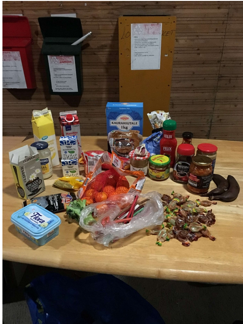
Kuva 3. Peltola B:n ruokahävikki 2.12.2019.

Suurin osuus eli lähes viidennes kaikesta ruokahävikistä koostui maitotuotteista, mikä oli odotettavissa jo tutkimusta aloitettaessa niiden herkän pilaantuvuuden vuoksi. Suurin osa maitotuotteista oli koskemattomia tai vain pieniltä osin syötyjä yhden kilogramman jogurttipakkauksia ja muita vastaavanlaisia tuotteita, kuten erilaisia rahkoja. Avaamattomista maitopurkeista, joiden pakkauksessa oleva käyttöpäivämäärä oli umpeutunut, todettiin osa aistinvaraisesti syömäkelpoisiksi.