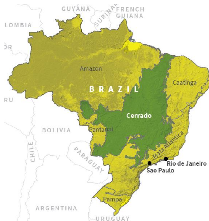
Kuva 1. Amazonin ja Cerradon alueet kartalla (Reuters 2018)

Amazon ei ole ollut Brasilian hallitusta tai ulkomaisia toimijoita kiinnostava alue. Nykyään kuitenkin alueeseen kohdistuu enemmän mielenkiintoa. Amazonin maankäyttöä ei juurikaan ole suunniteltu eikä maita ole laillisesti nimetty kellekään. Enemmän intressejä on kohdistunut Amazonin ja Cerradon väliselle rajavyöhykkeelle. Vuonna 2008 Amazonin maista 53 % olivat asutettuja ilman laillista maanomistusta tai epäselvästi omistuksessa. Jälkimmäisiin kuuluivat laittomasti hankitut maat, kartoittamattomat julkiset maat, asukkaat, joilla oli oikeus oleskella alueella, muttei oikeutta itse maahan sekä alkuperäisasukkaat, joiden maita ei ole laillisesti tunnustettu (Oliveira 2013). Virallisesti ja oikein rekisteröityjen alueiden määrä on vain 4 % koko Amazonista INCRA:n (National Institute of Colonization and Agrarian Reform) mukaan. Valtion ja osavaltioiden luomien suojelualueiden myötä noin 43 % alueesta on jotenkin suojeltua (Reydon et al. 2015). Vastaavasti Cerradon alueesta vain 2,2 % on suojeltua (Clements & Fernandes 2013).