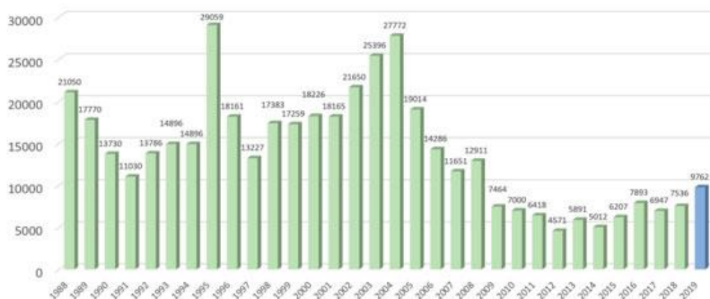
Kuva 2. Metsien hävittämisaste vuosina 1988–2019 (INPE 2019)

Metsien tehokas hävitys alkoi 1970-luvun alussa. Ennen vuotta 1970 metsiä oli hävitetty suhteellisen vähän verrattuna kyseisen vuoden jälkeiseen aikaan. Tuolloin hävitettiin vain vähän Portugalin valtiota suurempi alue. Tämän jälkeen hävitysaste kasvoi huomattavasti (Fearside 2005). Kuvasta kaksi nähdään, miten metsien hävitys on kehittynyt.