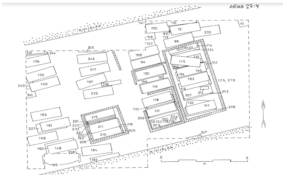
Kuva 3. Hailuodon hautojen sijoittuminen. 151

Kirkkohaudaus itsessään on kirkkoon sisälle tehty haudaus, jossa vainaja on haudattu kirkon lattian alle, lattian alaiseen tilaan. 149 Haudaus voi tapahtua arkussa tai ilman. Osa kirkkohaudauksista tehdään omiin, erillisiin hautakammioihinsa: salvoksiin. Puusta rakennetut salvokset ovat Hailuodossa toistensa päälle salvotuista hirsistä muodostuvia kehikoita, joihin arkussa makaava vainaja haudattiin. Tästä seurasi nimitys salvoshauta. Salvokset ovat hautakammioit, ja kammiot kuuluivat aina jollekulle, ollen usein sukuhautoja. 150 Multahaudaus tarkoittaa suoraan multaan, eli maahan, tehtyä hautausta ilman hautakammiota. On todennäköistä, että ainakin osa multahautoiksi nykyään luettavista hautauksista on ollut aikoinaan kammioon tehtyjä, mutta arkku tai arkuton vainaja on nostettu pois kammioista esimerkiksi salvoksen vaihtaessa omistajaa.