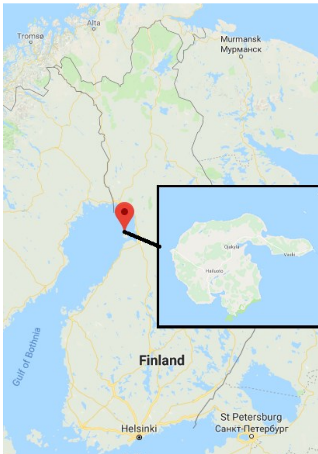
Kuva 1. Hailuodon sijainti. Google maps.

Ensimmäiset kirjalliset lähteet alueen asutuksesta ovat 1540-luvulta, 8 jolloin Hailuoto oli osa Salon pitäjää. Hailuoto koostui vielä 1766 neljästä saaresta: Luodosta, Hanhisesta, Santosesta ja Syökarista. 9 Luodolla, saarista suurimmalla josta nykyään käytetään nimitystä Hailuoto, oli kuitenkin siinä vaiheessa asuttu jo kauan: siitepölyanalyysien mukaan 1000-luvulta eteenpäin. 10 Vuoteen 1580 mennessä Hailuodossa oli jo 60 veroa maksavaa taloa, 11 huolimatta siitä, että Pohjois-Pohjanmaan viljasato pieneni vuosisaadan loppupuolella huomattavasti: vuonna 1562 Salon pitäjän viljasatoa saatiin 4946 panninalaa eli panna 12 ja vuonna 1580 vain 1373 panna. 13 Val-