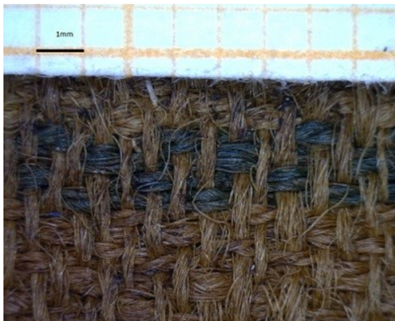
Yksityiskohta tekstiilistä KM86088:533 lapsen haudasta 116.

Lisäksi vainajan 116 arkusta löytyi kasvijäänteitä, sekä hiuksia. Kasvijäänteet on yksiselitteisesti selitetty siemeniksi. Tarkempi tutkimus kasvinäytteestä valmistunee lähitulevaisuudessa. Erilaiset kasvinjäänteet voivat olla peräisin estetiikan vuoksi valituista kasveista. Tuoreita kasveja on käytetty paljon esimerkiksi Ruotsissa. Kasvit ovat myös voineet olla lääkekasveja, sillä vainajalle on Ruotsissa voitu kuoleman jälkeen laittaa arkkun lääketta mukaan. 190 Kasveilla voi myös olla symbolinen merkitys.