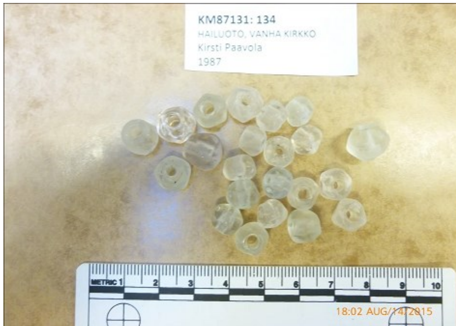
Kuva 4. Fasetoituja helmiä lapsen haudasta 163.

Hautaus 213 oli tehty aikuisen (hautaus 207) jalkoihin. Lapsi ja aikuinen oli haudattu samaan, noin 185 cm pitkään arkkuun, josta oli jäljellä vain osia pääty ja kansilaudoista. Tämän vainajan sukupuolta ei ole raportissa pohdittu. Aikuisen vainajan alavartalon päällä on tuohilevyä. Löytöinä lapsivainajan 213 osalta on otettu talteen silkkinauhaa, 16 palaa silkkiä, luita, pronssin paloja, mahdollisen hiuskorun paloja, tuohisilmukka, useita lasihelmiä, nuppineulan katkelma, pieni pala vihreää lasia, nuppineula ja paloja useammasta sekä paloja villakankaasta ja villanauhasta, jossa on jälkiä pronssihomeesta. Kyseessä voi olla kappale kastevyötä tai sen imitaatiota. Hautojen sekalaisista löydöistä osa voi olla jäänteitä seppeleistä, joita haudoissa selkeästi on käytetty 1700-luvulla, kuten Saloisten ja Kempeleen aineistot osoittavat.